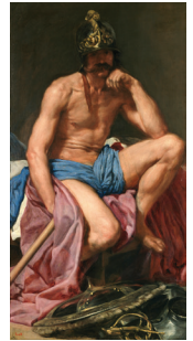
Diego Velázquez: Mars (Museo Nacional del Prado)

Anmeldeschluss: 16.9.2016, Änderungen vorbehalten!