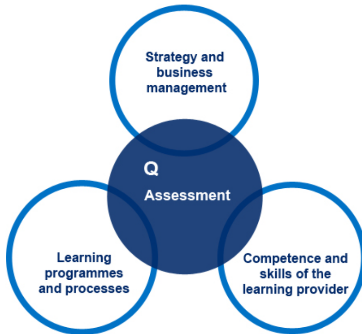
Abbildung 1: Vier Normbereiche (nach Rau 2008, S. 21)

Abbildung 1 zeigt die vier großen Bereiche der Norm, denen die Anforderungen zugeordnet sind, auf einen Blick und in der internationalen Begrifflichkeit, wobei „Q“ für quality steht.