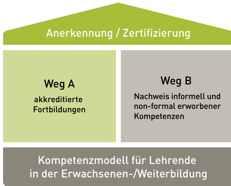
Abbildung 1: Anerkennung/Zertifizierung von Kompetenzen Lehrender in der EB/WB

Da der Erfolg und Nutzen eines Kompetenzmodells stark von dessen Akzeptanz seitens der Zielgruppe abhängt, wurde bei der Entwicklung des Modells (Lencer & Strauch, i.E.) Wert darauf gelegt, theoretische Grundlagen zu analysieren, bestehende Kompetenzmodelle zu berücksichtigen, Praktiker- und Expertenmeinungen zu erheben und einen stetigen Rückkopplungsprozess zwischen Wissenschaft und Praxis zu sichern. So wurde ein multimethodisches Vorgehen gewählt, das sowohl eine Theorieanbindung als auch eine systematische Einbindung von Praktikern beinhaltet.