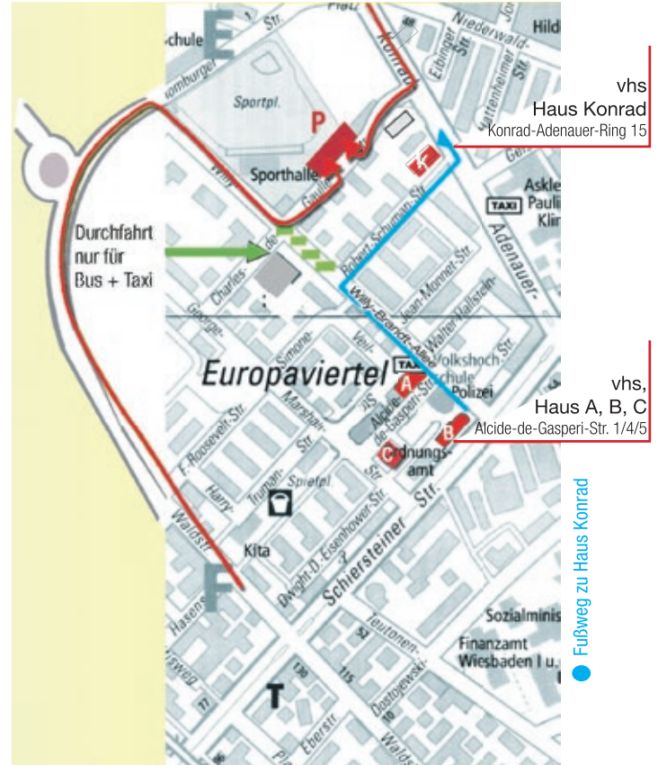
vhs Haus Konrad Konrad-Adenauer-Ring 15