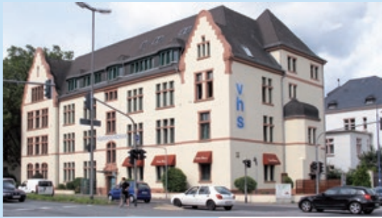
Haus B, Alcide-de-Gasperi-Str. 5