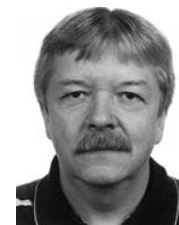
Prof. Dr. phil. Martin Pinquart lehrt Entwicklungspsychologie an der Universität Marburg

Der vorliegende Beitrag gibt einen Überblick über die entwicklungspsychologische Forschung zur (In-)Stabilität von Aspekten der Persönlichkeit im Erwachsenenalter. Neben den Kernmerkmalen der Big Five werden sog. Oberflächenmerkmale betrachtet. Hierbei werden Veränderungsrichtung und Ausmaß der Veränderung für verschiedene Dimensionen der Persönlichkeit verglichen und Einflüsse auf die Veränderung der Persönlichkeit beschrieben. Abschließend werden Schlussfolgerungen für die Erwachsenenbildung gezogen.